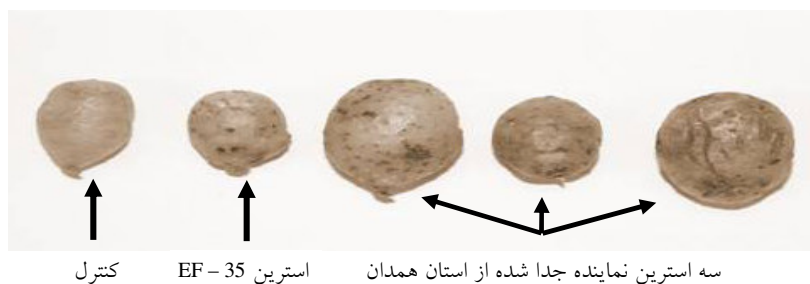
شکل ۱- اثبات بیماری‌زایی استرین‌های Streptomyces روی غده‌های نارس سیب‌زمینی