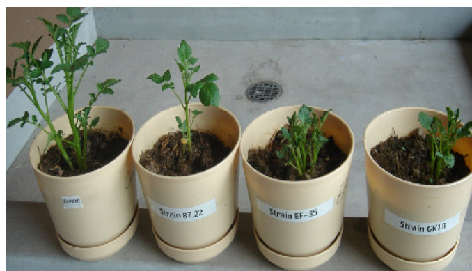
شکل ۲- اثبات بیماری‌زایی استرین‌های Streptomyces روی بوته‌های سیب‌زمینی (به ترتیب از سمت چپ:

استرین‌های استرپتومایسس جدا شده از مزارع مختلف سیب‌زمینی استان همدان که بیماری‌زایی آن‌ها روی غده‌های سیب‌زمینی به اثبات رسیده بود در شرایط گلخانه علائم مشابه علائم مزرعه‌ای را روی غده‌های سیب‌زمینی ایجاد کردند. این استرین‌ها سبب کاهش رشد بوته‌های سیب‌زمینی در شرایط گلخانه شدند (شکل ۲).