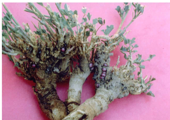
شکل ۱- استقرار کیست‌های شیشک روی طوقه گیاه یونجه

ساقه‌ها متمرکز بودند و به نظر می‌رسد که در محل‌های زخم وارده توسط سرخرطومی ریشه یونجه Sitona sp. که نسبتاً فرو رفته و عمیق هستند استقرار یافته و از شیرۀ گیاهی طوقه و ریشه یونجه تغذیه کردند. آلودگی در برخی بوته‌های نمونه برداری شده بسیار شدید بود به طوری که حتی در اوایل تیر ماه تعداد ۱۸۱ عدد کیست آفت از روی یک بوته جداسازی شد.