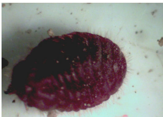
شکل ۵- حشره ماده شپشک ریشه یونجه درشت نمایی ۱۰ برابر

Margarodidae بالدار بوده و بال های جلویی کاملاً مشخص و رگبال زیر کناری آنها کاملاً ضخیم و پهن و به رنگ قرمز تیره و با رگبال کناری تشکیل یک سلول نسبتاً مشخص و رنگی می دهند. بال های عقبی حشره رشد نکرده و تشکیل هالتر داده اند. حشرات نر پس از ظهور و بیرون آمدن از سطح خاک به صورت جهشی روی سطح خاک به تحرک می پردازند، به طوری که با اندکی دقت می توان جهش های کوتاه و ناگهانی آنها را به وضوح روی سطح خاک مشاهده کرد.