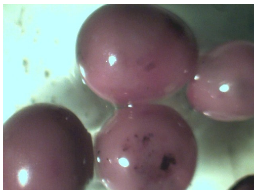
شکل ۴- کیست‌های شپشک ریشه یونجه درشت نمایی ۱۰ برابر