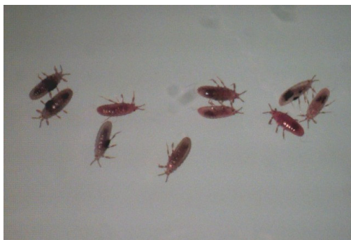
شکل ۳- پوره‌های سن یک شپشک ریشه یونجه درشت نمایی ۱۰ برابر