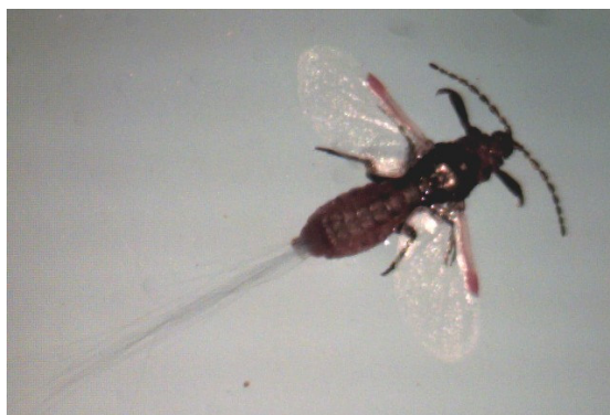
شکل ۶- حشره نر بالدار شپشک ریشه یونجه درشت نمایی ۱۰ برابر