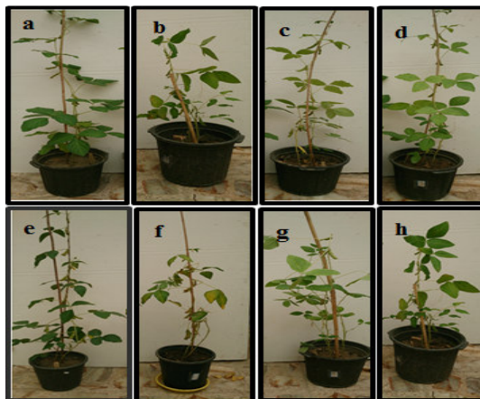
شکل ۱- مایه‌کوبی TSV در ارقام ویلیامز (a,b,c,d) و کتول (e,f,g,h). a و e بوته‌های شاهد سالم، b و f بوته‌های آلوده به جدایه سویا، c و g بوته‌های آلوده به جدایه ماش، d و h بوته‌های آلوده به جدایه آفتابگردان.

سامان (جدایه سویا) معنی‌دار بود. کاهش ارتفاع بوته‌ها توسط جدایه سویا در همه ارقام (به جز ویلیامز) نسبت به نمونه شاهد معنی‌دار بود. مایه‌زنی جدایه‌های مختلف ویروس در ارقام سامان و ساری تفاوت معنی‌داری بر ارتفاع بوته‌ها ایجاد نمود (شکل ۱).