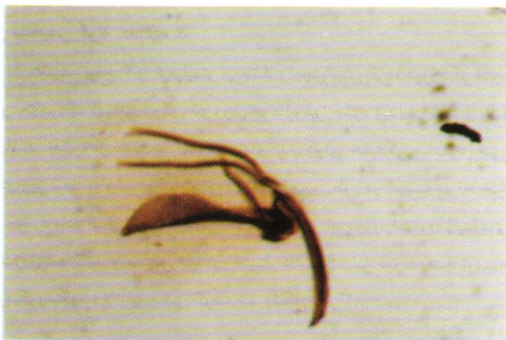
شکل ۲- ژنیتالای حشره نر S. oryzae (L.) درشت نمایی ۲۲۷/۵ برابر.