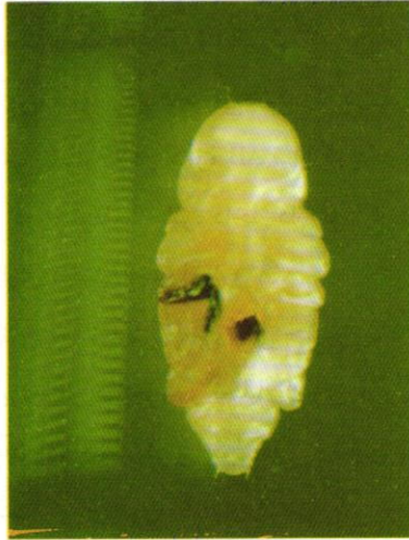
شکل ۴- شفیره ماده S. oryzae (L.) درشت نمایی ۱۳۷/۵ برابر.