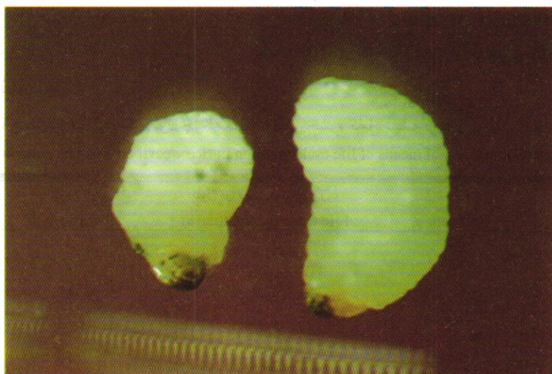
شکل ۵ - لاروهای S. oryzae (L.) درشت نمایی ۱۴۰ برابر.

داده‌های حاصل از طول چرخه زندگی کامل این حشره (شروع تخمگذاری تا ظهور حشره) روی ارقام مختلف برنج مورد تجزیه و تحلیل آماری قرار گرفت (جدول ۱۰ و ۱۱). نتایج بدست آمده حاکی از آن بود که بیشترین طول دوره رشدی شپشه برنج روی برنج فجر با میانگین ۳۶/۰۰ روز بوده است که در گروه A قرار گرفت. پس از آن برنج خزر با میانگین ۳۱/۶۷ روز در گروه B و برنج نعمت با میانگین ۲۹/۶۷ روز در گروه BC جای گرفتند. در نهایت برنج‌های طارم محلی و ندا با میانگین ۲۳/۶۷ در گروه C قرار گرفتند. در ضمن انجام این آزمایش به طور تصادفی دو عدد لارو در یک دانه مشاهده شدند که از این دو لارو، یکی موفق به ادامه رشد گردید و دیگری از بین رفت (شکل ۵).