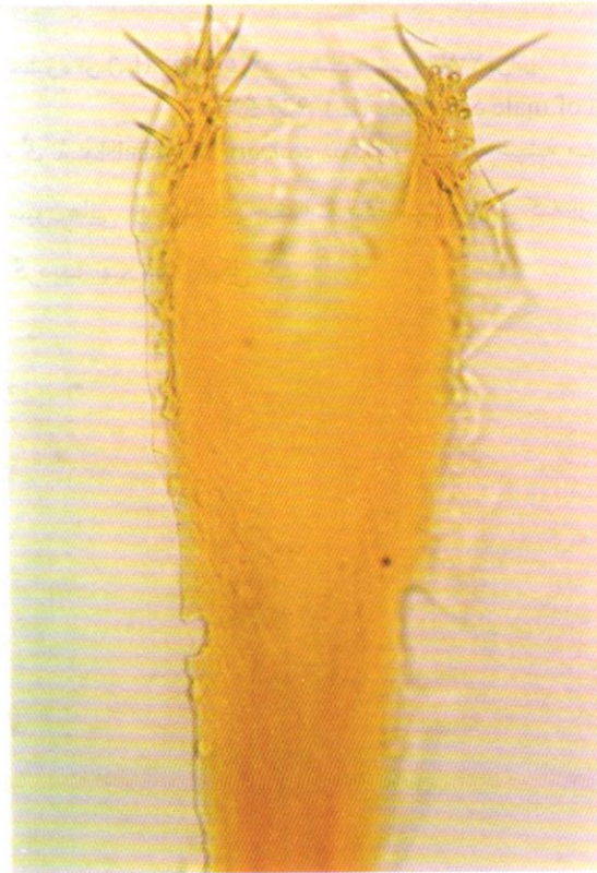
شکل ۱- ژنیتالیای حشره ماده S. oryzae (L.) درشت نمایی ۲۰۰ برابر. Fig.1. Genitalia of female S. oryzae (L.). 200X.

طول بدن شپشه برنج ۳ تا ۵ میلیمتر می باشد و روی پیش گرده فرورفتگی های گرد وجود دارد و دو لکه بزرگ قهوه ای روشن نیز روی هر بالپوش حشره دیده می شود و بال های زیری فعال می باشند. حشره نر نسبت به ماده در انتهای بدن دارای خمیدگی بیشتری می باشد این موضوع در زیر لوپ به وضوح قابل مشاهده است. همین طور در شپشه برنج خرطوم نرها نسبت به حشره ماده ضخیم تر و کوتاه تر است. علاوه بر این، پریپاراسیون ژنیتالیای حشرات ماده و نر تهیه شد و سپس با در اختیار داشتن این نمونه ها، توسط دستگاه فتواستریومیکروسکوپ از آنها عکس گرفته شد (شکل ۱ و ۲).